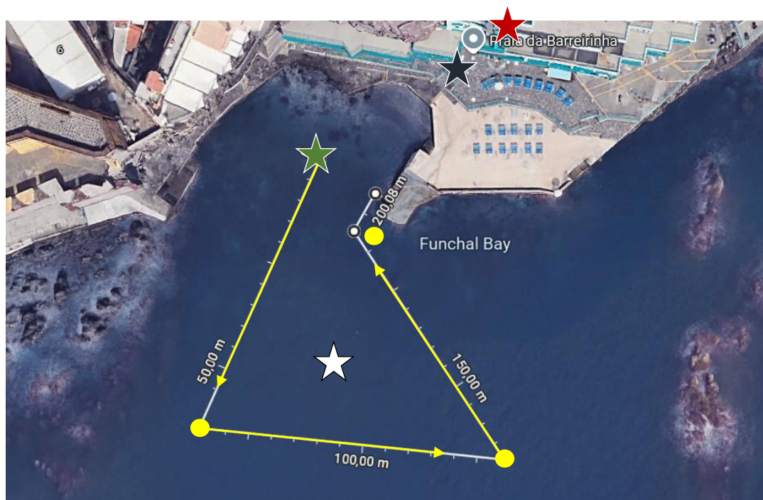
Imagem 2. Croqui da 1.ª Prova de Mar dos "Jogos Nacionais Salesianos".

Esta prova disputar-se-  em formato de "Sprint". As boias de contorno obrigat rio ficam   esquerda dos nadadores, exceto a  ltima (  direita). Estas boias ter o obrigatoriamente de ser contornadas de acordo com o indicado. A partida ser  feita dentro de  gua,   frente da zona de rebenta o, e a chegada em terra (nas escadas laterais do cais). Aten o  s informa oes de  ltima hora, 16h15 – Briefing , que explica resumidamente o percurso da prova. D vidas relativas ao assunto devem ser colocadas aqui.