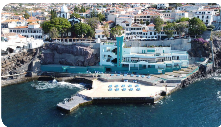
Imagem 1. Complexo Balnear da Barreirinha, Funchal.